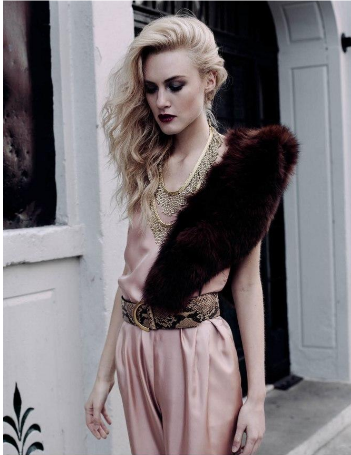
JUMPSUITE_LA PRESTIC OUISTON BELT_BURBERRY NECKLACE_MALENE BIRGER FUR_ALVIERO MARTINI